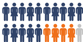
Casos activos, fallecidos y recuperados de COVID-19 en la Provincia de Santa Fe (cada 7 días) en los últimos 120 días