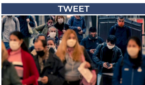
COVID-19 - EN DIRECTO